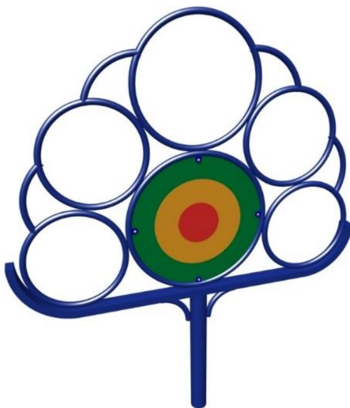
Стенд для игры «Попади в цель»