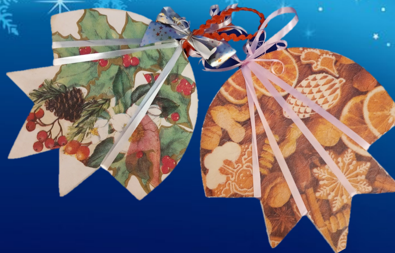
«ЦЕПЛЫНЯ НА НА ГАЛІНЦЫ» (III месца) Мастыка Яўгенія, 11 гадоў Аб'яднанне па інтарэсах «Мадэляванне» Студзёнкаўская сярэдняя школа ім. П.Л.Бабака