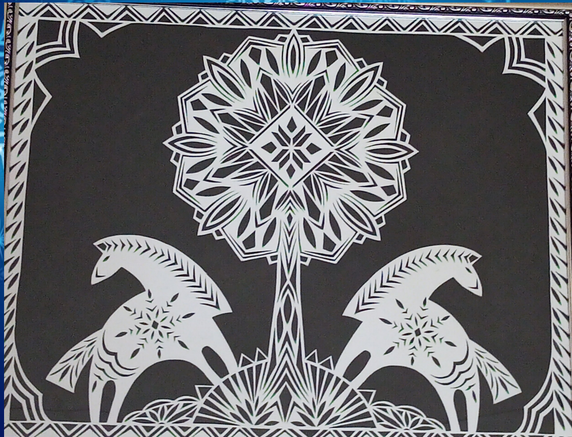
«НА ШЧАСЦЕ» (II месца) Рагоўская Мілана, 13 гадоў Аб'яднанне па інтарэсах «Папяровы вектар» Сенненскі раённы цэнтр дзяцей і моладзі