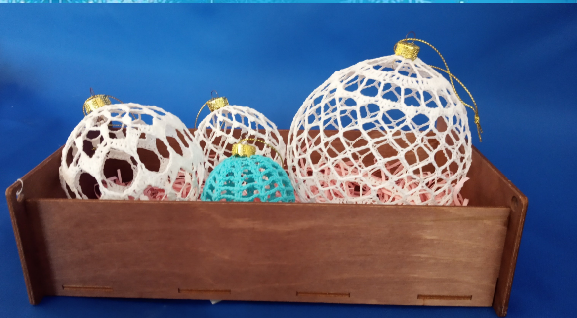
Султанава Вераніка, 15 гадоў Аб'яднанне па інтарэсах «Маленькія творцы» Сенненскі раённы цэнтр дзяцей і молдадзі