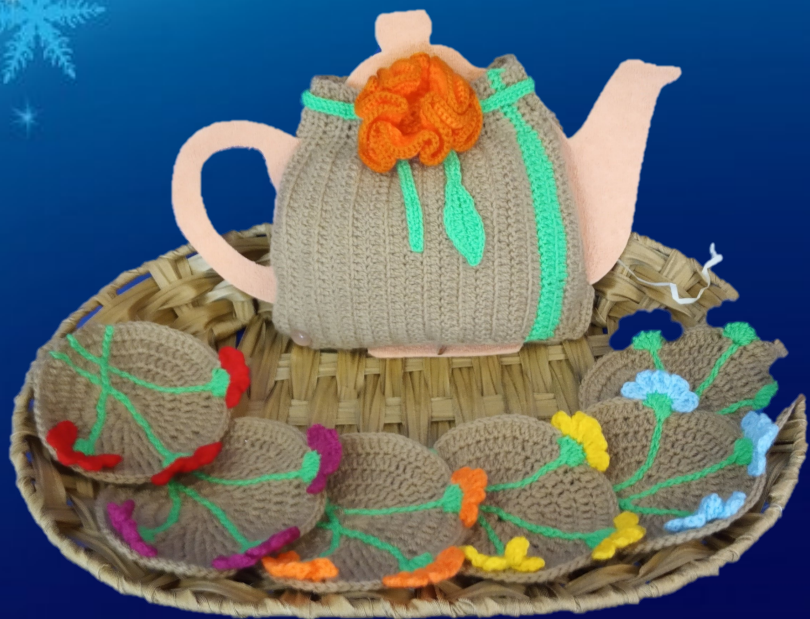
«НАБОР СУРВЭТАК ДЛЯ ГАРБАТЫ» (1 месца) Масалава Варвара, 10 гадоў, Карповіч Дар'я, 10 гадоў Аб'яднанне па інтарэсах «Маленькія творцы» Сенненскі раённы цэнтр дзяцей і моладзі