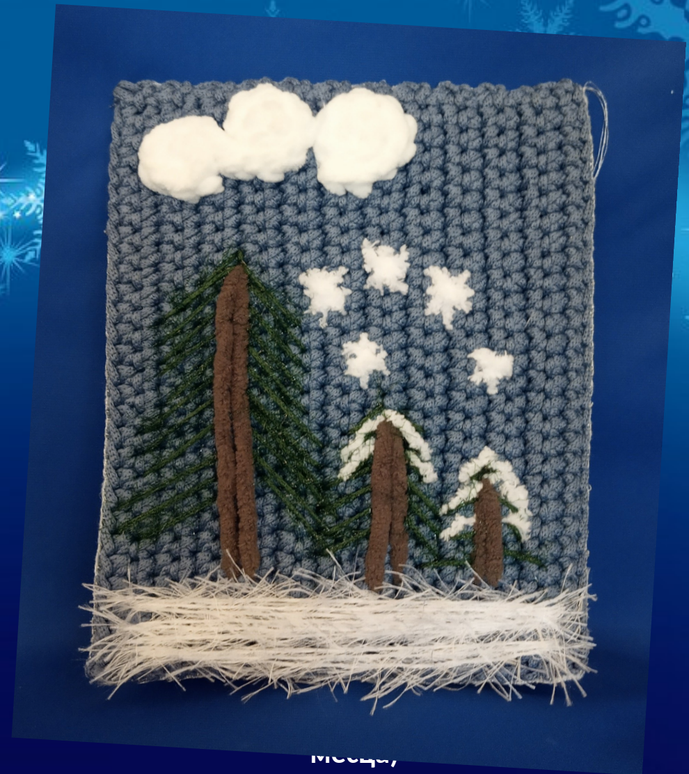
месца, Шалуха Ульяна, 13 гадоў Машканская сярэдняя школа ім. А.К.Гараўца