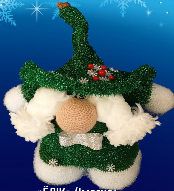
«ЁЛІК» (1месца) Крывапуст Вікторыя, 12 гадоў Сярэдняя школа №2 г.Сянно імя А.К.Касінцава