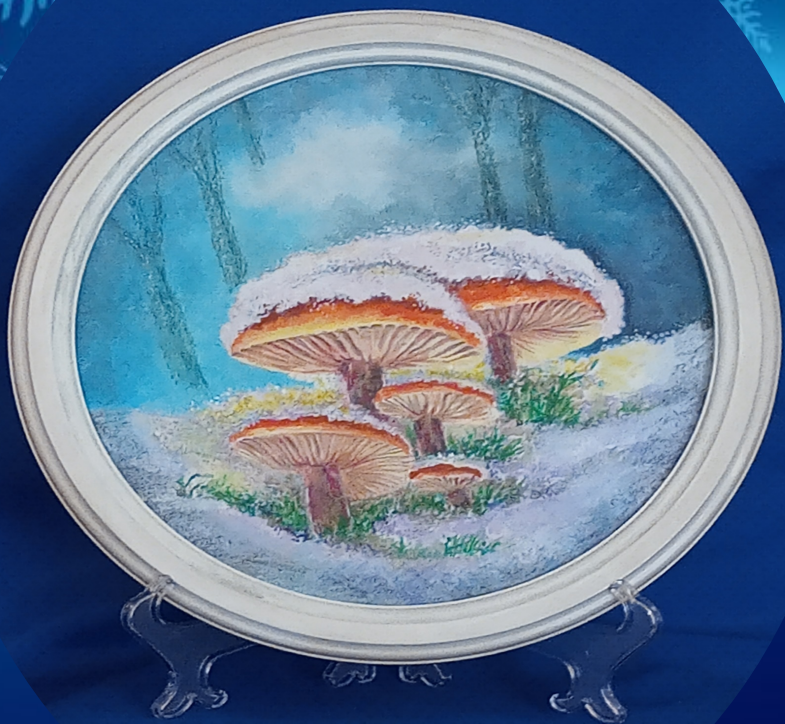
«ГРЫБНАЯ ПАРАДІЦА У ЛЕСЕ НЕ ПАСПЕЛА»