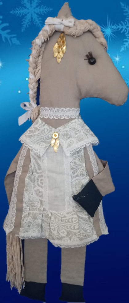
«ГУЛЛІВЫ КОНІК» (1 месца) Стрыжнёва Елізавета, 16 гадоў Аб'яднанне па інтарэсах «Цацкі з тэкстылю» Сярэдня школа №2 г.Сянно імя А.К.Касінцава