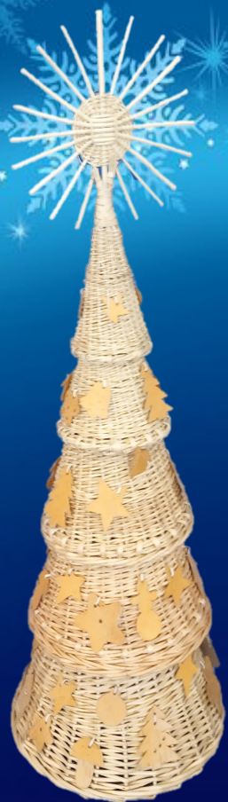
«СВЕТ ДАЛЁКАЙ ЗОРКІ» (II месца) Латышава Юлія, 14 гадоў, Шчоткін Дзмітрый, 14 гадоў Аб'яднанне па інтарэсах «Лозапляценне» Ходцаўская сярэдняя школа