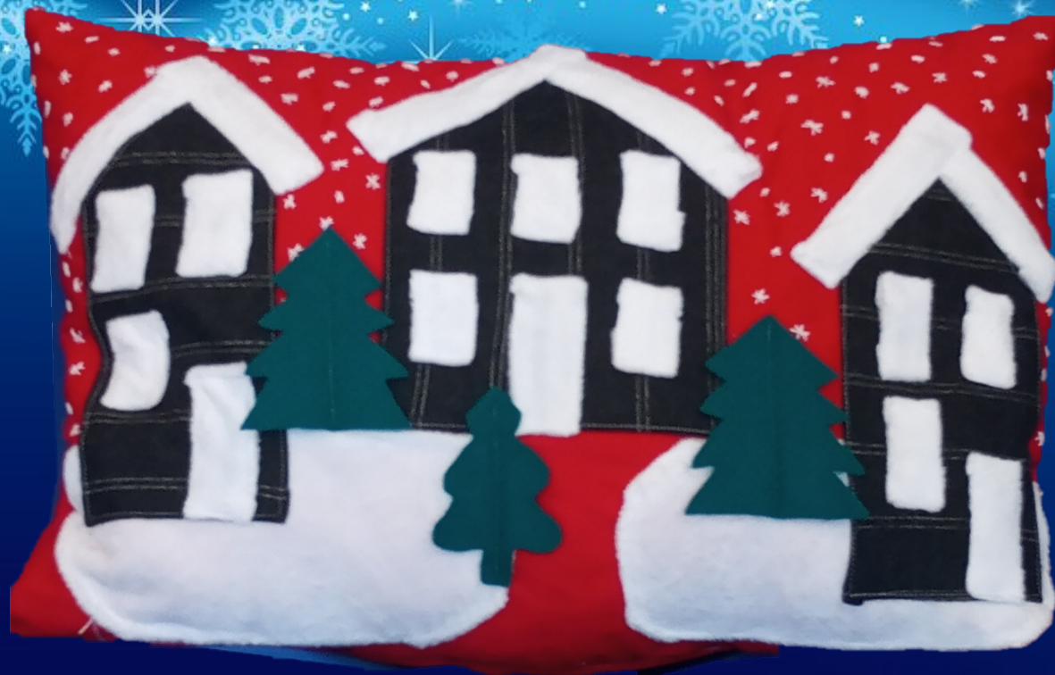
«НАВАГОДНІ СОН» (1 месца) Пераверзева Элеанора, 12 гадоў Аб'яднанне на інтарэсах «Тэкстыльныя фантазіі» Сенненскі дзіцячы дом