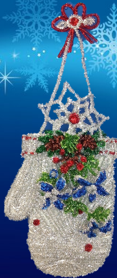
«ЧАРОЎНАЯ РУКАВІЧКА» (III месца) Беразнева Аліна, 10 гадоў, Кісялёва Юлія, 10 гадоў Аб'яднанне па інтарэсах «Умелья рукі» Какоўчынская сярэдняя школа